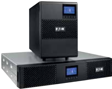
Rack- und Tower-Modell der 9SX