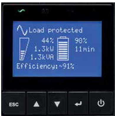
Grafisches LCD-Display der 9SX